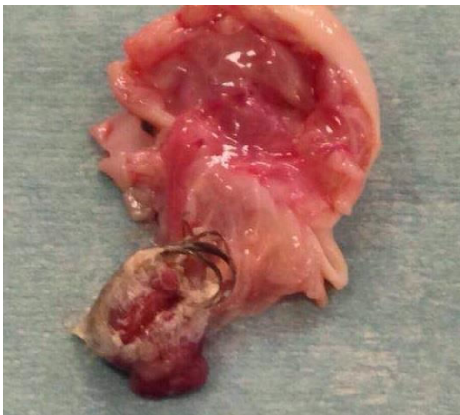
Figura 1. Anejo derecho. Destaca el teratoma con contenido sebáceo y folículos pilosos.

RESULTADOS: Paciente de origen balcánico de 23 años que es traída por su pareja a la puerta de urgencias por intento de defenestración. La paciente refiere cefalea de una semana de evolución que se ha hecho más intensa los 3 días previos. La paciente no presenta hábitos tóxicos, y como antecedentes de interés: epilepsia en tratamiento con oxcarbazepina, trastorno disocial y un trastorno del comportamiento con varios intentos de autolisis. G2P2.